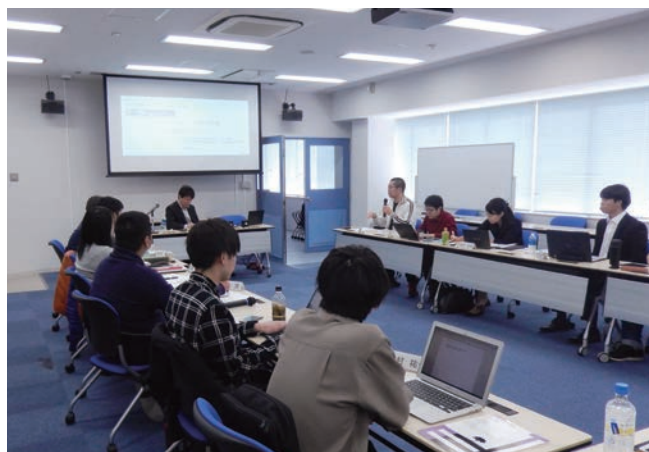
写真は昨年度までの授業風景です。